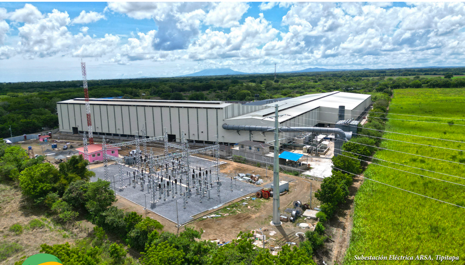
Subestación Eléctrica ARSA, Tipitapa

En cuanto a la expansión de la generación, informó que se incorporaron 25 MW de la ampliación de la Planta de Cogeneración del Ingenio Monte Rosa y 14 MW de la Planta Solar San Isidro; ambas en el occidente del país, fortaleciendo la capacidad instalada renovable. Resaltó los avances en la construcción de las Plantas Solares APAS I y II de Enacal, así como los 30 MW de Sun Power en Nagarote y el inicio de la obras de El Hato, de 67 MW, que será ejecutado por Enatrel. Asimismo, indicó que entre los años 2026 y 2028 se prevé la incorporación de 312.20 MW adicional es, como parte del plan de expansión del sector.