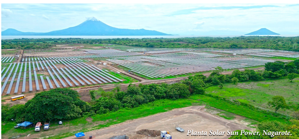
Planta Solar Sun Power, Nagarote.