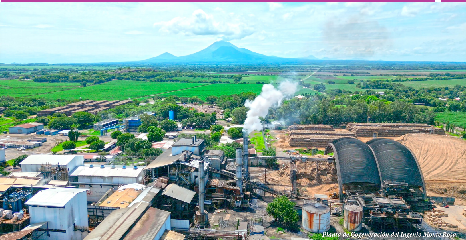
Planta de Cogeneración del Ingenio Monte Rosa.

El Cro. Mansell resaltó que Nicaragua mantiene una matriz energética con alto componente de fuentes renovables, con un promedio del 72%, y proyecciones de alcanzar hasta un 80% en los próximos años. En este contexto, subrayó los avances en la implementación de sistemas de almacenamiento con baterías de litio, desarrollados en coordinación con empresas de la República Popular China, orientados a fortalecer la estabilidad del sistema y optimizar el aprovechamiento de la generación renovable.