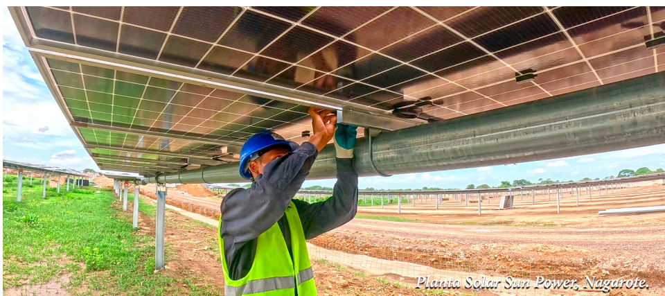
Planta Solar Sun Power, Nagarote.

Concluyó que el fortalecimiento del sector eléctrico nacional es fundamental para garantizar un suministro continuo, seguro y confiable, que acompañe el crecimiento económico, el desarrollo de proyectos estratégicos y el bienestar de las familias nicaragüenses.