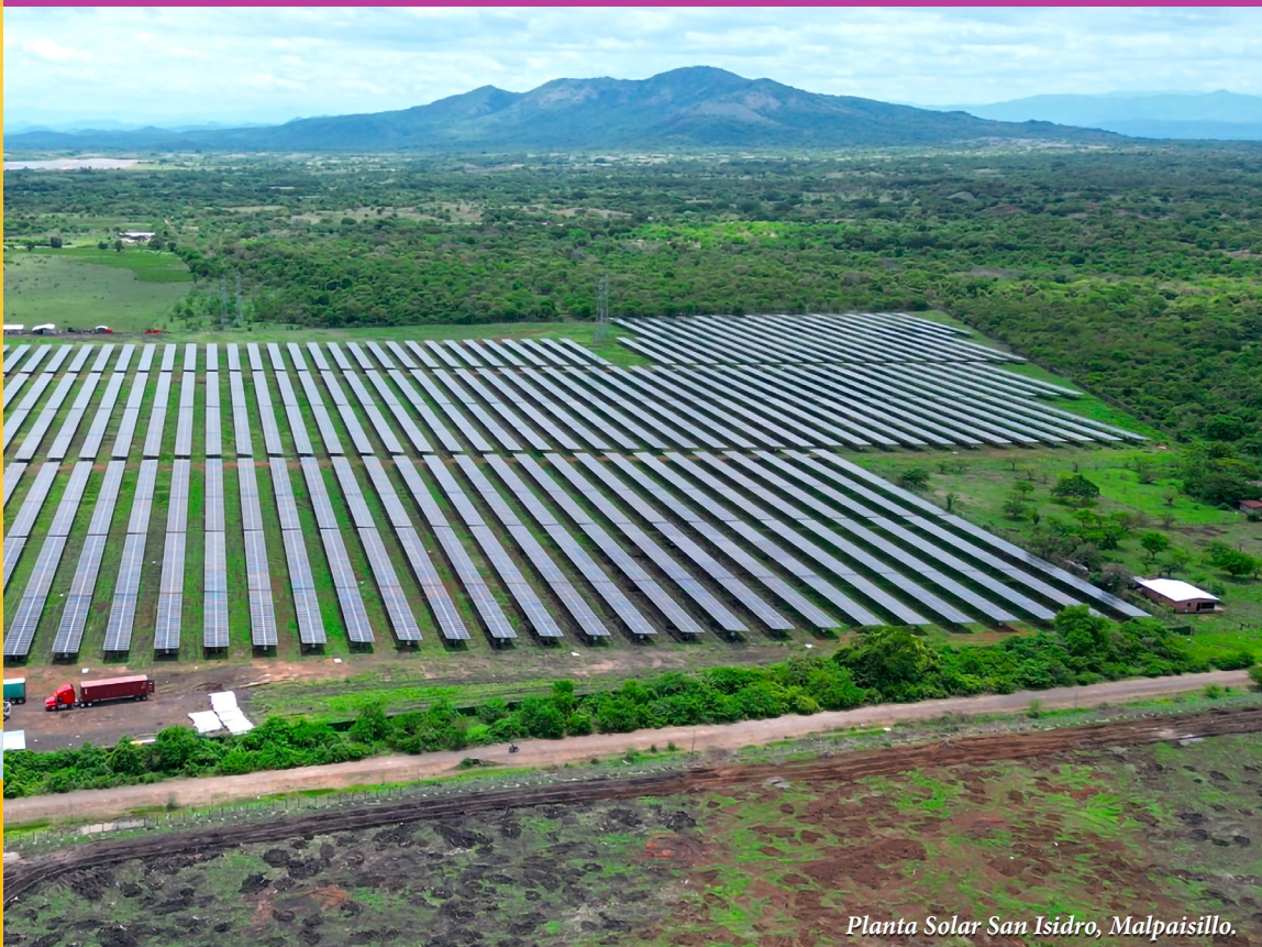
Planta Solar San Isidro, Malpaisillo.

CON ALEGRÍA SE VIVE EL ESPÍRITU NAVIDEÑO EN LA CAPITAL